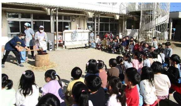
おかわりしました♪